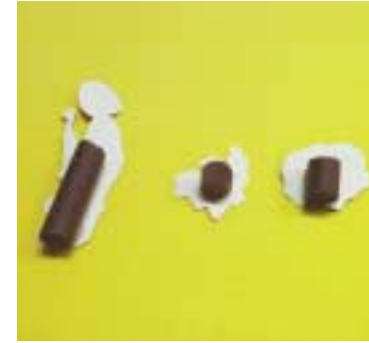
⑨ 자른 백업을 글루건을 이용해 그림 뒷면에 붙입니다.