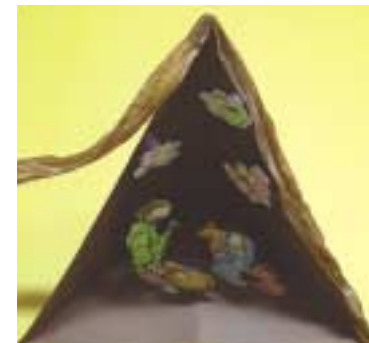
⑫ 글루건을 이용하여 ⑪을 틀의 바깥 모서리에 붙여 줍니다.