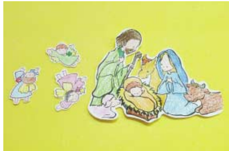
⑦ 예수님 탄생 모습을 나타내는 도안을 준비하거나 직접 밑그림을 그려 예쁘게 색칠한 후 가위로 오릅니다.