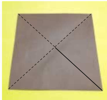
④ 색상을 펼쳐 사진에 표시한 부분만 가위로 자릅니다.