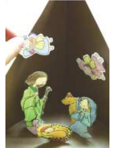
⑩ 백업을 붙인 그림 조각들을 글루건을 이용해 ⑥에 붙입니다.