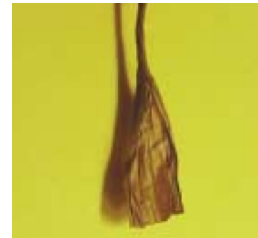
⑪ 사진처럼 꼬인 상태의 지끈을 풀어 줍니다.