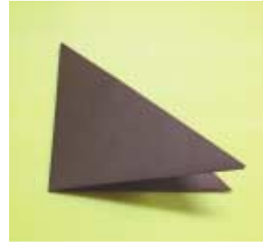
③ 반으로 한 번 더 접습니다.