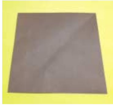
① 갈색 색상을 38cm×38cm의 정사각형으로 자릅니다.