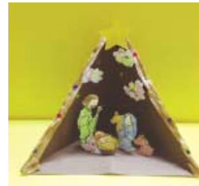
⑬ 노란색 색종이로 별 모양을 오려 윗부분에 붙입니다.