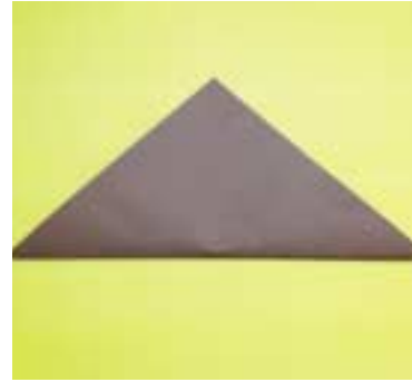
② 자른 색상을 삼각형 모양으로 접습니다.