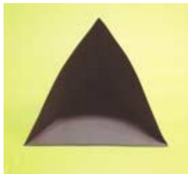
⑥ 겹쳐 놓은 부분을 풀로 붙여 전체 틀을 만듭니다.