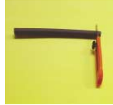
⑧ 백업을 자릅니다. 그림 뒷면에 붙여야 하기 때문에 그림의 크기에 맞추어 적당한 길이로 자릅니다.